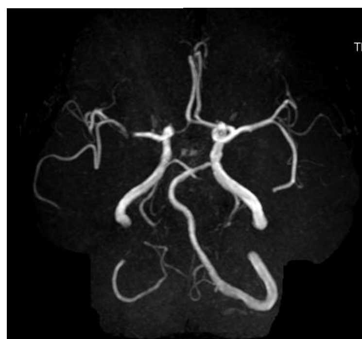
左上肢拳上、立位可能