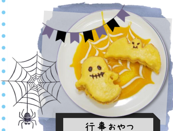
行事おやつ ハロウィーンケーキ

かぼちゃクリームは優しい甘さで、皿の上のクモの巣の模様は調理師がひとつひとつ丁寧に描いています。