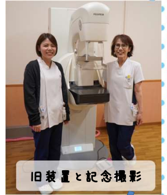
旧装置と記念撮影