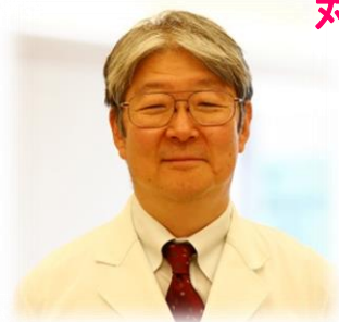
呼吸器外科 小阪副院長